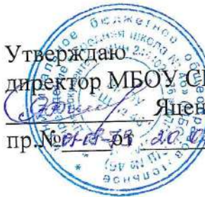
График проветривания учебных кабинетов начальная школа