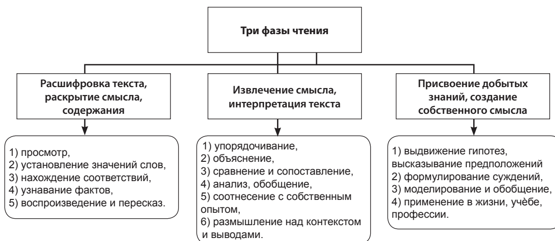
Рис. 1. Фазы чтения

рится в высказывании», т.е. мыслей, связей, отношений, причин, следствий, скрытых за словами текста, а именно – подтекста.